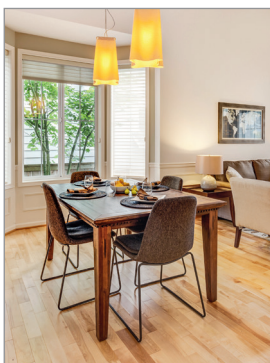
Asphärische torische Premiumlinse