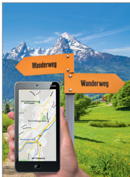
Asphärische trifokale Premiumlinse