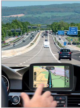
Asphärische bifokale Premiumlinse